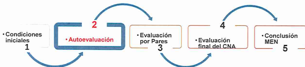
Ilustración 1 – Procedimiento para la Acreditación

Para la acreditación institucional y de programas, están definidos los siguientes procedimientos generales: